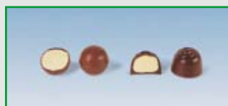
One-Shot Pralinen, Trüffeskugeln, Eier, Likörpralinen