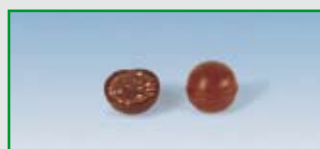
One-Shot mit Ingredienzen