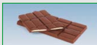
Gefüllte Tafeln (Long One-Shot)