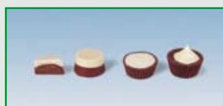
2 Lagen Guss Power One-Shot