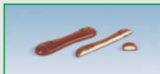
Gefüllte Riegel (Long One-Shot)